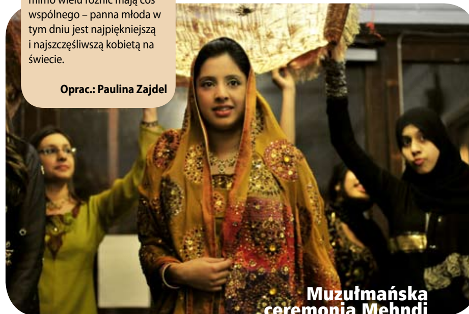
Muzułmańska ceremonia Mehndi